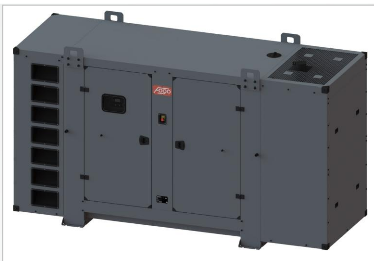
Zdjęcie przykładowe, szczegóły mogą odbiegać od ilustracji