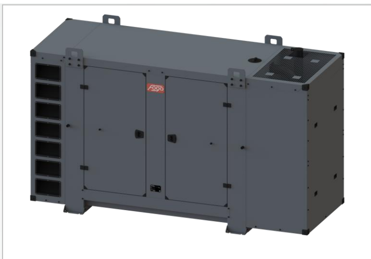
Zdjęcie przykładowe, szczegóły mogą odbiegać od ilustracji