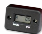
Licznik czasu pracy